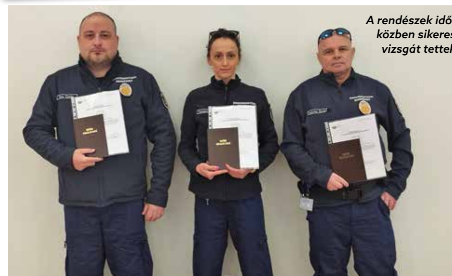
A rendészek időközben sikeres vizsgát tettek