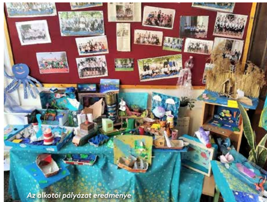
Az alkotói pályázat eredménye

Iskolánkban igyekszünk minél inkább a teremtett világ megóvására, a fenntarthatóságra nevelni a gyermekeket. Így az idei évben is megemlékeztünk a víz világnapjáról, mégpedig, rendhagyó módon, egy alkotói pályázat keretében.