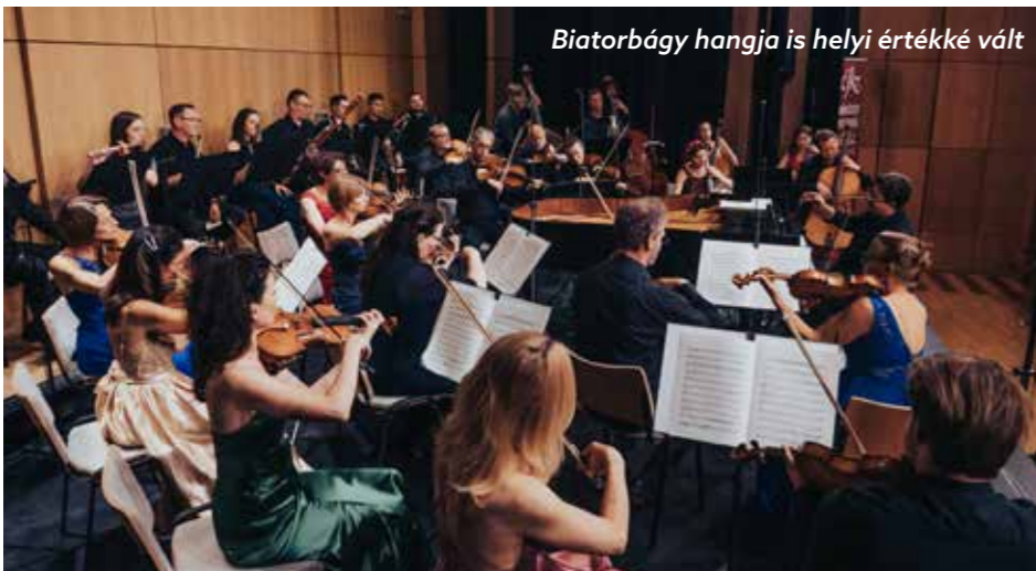
Biatorbágy hangja is helyi értéké vált