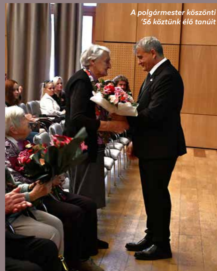
A polgármester köszönti '56 köztünk élő tanúit