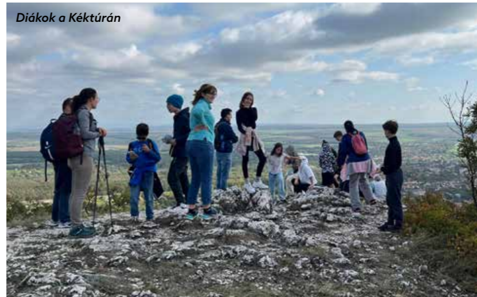
Diákok a Kéktúrán